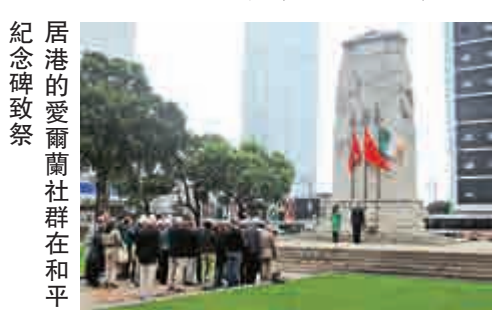
居港的愛爾蘭社群在和平紀念碑致祭

英格蘭、蘇格蘭、威爾士和愛爾蘭的主保聖人分別為聖佐治、聖安德魯、聖安德和聖帕特里克，每年有不同的紀念日，其中愛爾蘭在三月十七日。居港的愛爾蘭社群在這天到花園道的聖若瑟堂參加彌撒，然後前往和平紀念碑向兩次大戰的死難者致祭。碑上掛了愛爾蘭國旗，由綠、白、橙三個相等的豎長方形組成。