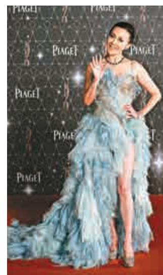
▲劉嘉玲擔任頒獎嘉賓