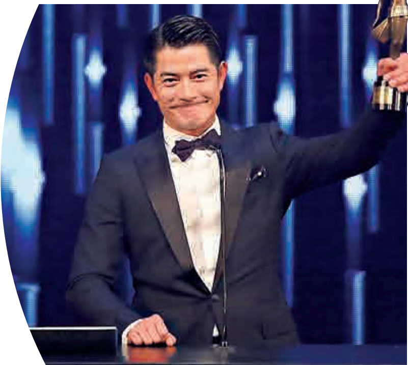
▲城城喜獲「最佳男主角」