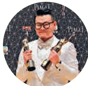
▲白只連奪兩獎，喜不自勝