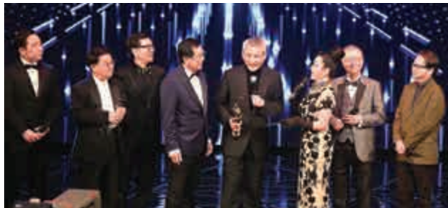
▲徐克（左五）攞「最佳導演」，由一群童星出身的演員頒獎