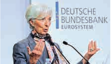
▲拉加德表示，全球經濟繼續復甦和增長，惟復甦過程依然過於緩慢和脆弱

拉加德的言論令外界揣測，國際貨幣基金組織於4月12日（下周二）公布的全球經濟展望報告時，可能下調對全球增長預測。