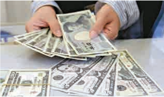
►有分析表示，除非美元跌至110日圓以下，或會觸發日本央行採取實際市場行動 資料圖片

外匯策略員指出，本周油價下跌，市場承擔風險情緒欠佳，這些因素令到美元兌日圓下跌，日圓兌其他貨幣同時走高。