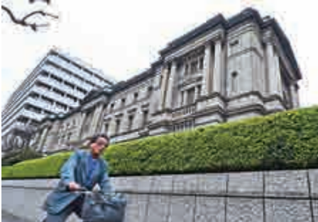
▲日本央行早前推出負利率措施，惟成效不彰，為再次壓低日圓匯價不得不加碼量寬

誠然，負利率政策雖能刺激銀行借貸，惟代價不菲，而新措施最終仍未能滿足市場的需求，尤其是在歐元區等多國持續