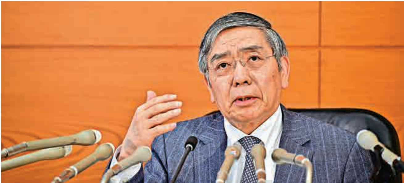
◀日本央行行長黑田東彥

由於市場揣測聯儲局放慢加息步伐，大多數新興亞洲貨幣年初以來表現企穩；外匯分析員稱，油價再展跌勢，投資者沽售新興市場貨幣套現離場，預料未來仍會有更多調整。