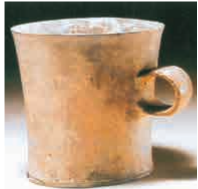
鬻，同樣是大汶口文化古陶十分獨特的品種。

之一，乃單耳圓體壺式陶杯。大汶口文化主要分佈於山東與江蘇北部。根據「碳十四」年代測定，距今約六千年至四十二百年左右，經歷時間近二千年之長；與以彩陶聞名的仰韶文化及馬家窯文化同期。此陶杯出土自山東泰安大汶口墓（四十七），約為公元前二八〇〇年至二四〇〇年之間製造，已屬大汶口文化較後期。陶杯高九點八公分，口徑十公分。那時該區陶器，以手製為主，晚期已僅用慢輪修整，故陶器口沿部分顯得十分規整。絕大部分泥質陶經過磨光，部分細砂陶也經打磨；其中以「背水壺」是其特有器型。雙層口「鬻」與封口「