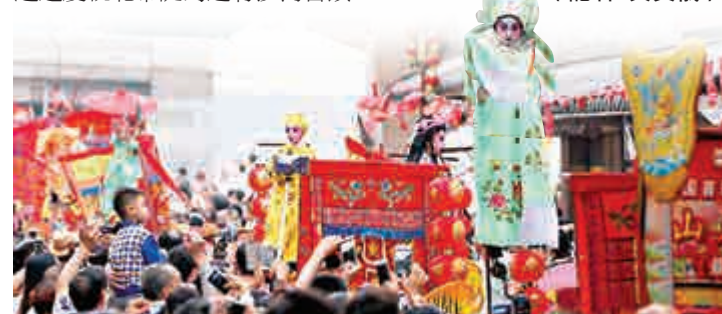
▲黃埔古村「北帝誕」9日如期開鑼