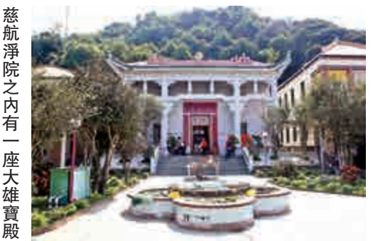
慈航淨院之內有一座大雄寶殿

慈航淨院除弘揚佛法，亦興學育才。一九五二年智林法師開辦義學，校舍由胡文虎昆仲捐助。一九八二年向政府申請在圍洲角興建小學，名為「慈航學校」。今天大埔的佛教大光慈航中學，其前身之一也是由慈航淨院興辦的。