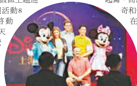
▲遊客排隊與米奇米妮合影留念

此外，每逢周末該展覽將全天進行4場舞台演出，熱情洋溢的舞者將伴隨着歡快的旋律翩翩起舞，而深受喜愛的米奇和他的夥伴們會在此與觀眾見面、合影，將純真快樂傳遞至每個人的心中。