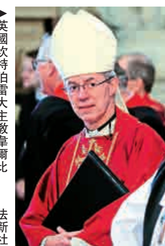
▲英國坎特伯雷大主教章爾比