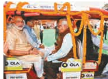
▲印度總理莫迪（左）搭乘一輛突突車，為網上打車平台OLA宣傳

據悉，這些車將由一家小額貸款公司出資購置，將被分發給沒有車（生活條件較差）的市民，他們成為車主後，通過上交每日收入的一部分來償還租金。此外，這一計