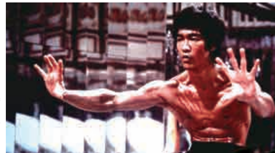
▲李小龙主演的《龍爭虎鬥》資料圖片

紐約懷舊功夫電影節由主辦紐約亞洲電影節的地鐵影院和經典電影檔案館聯合主辦，香港駐紐約經貿處提供贊助。