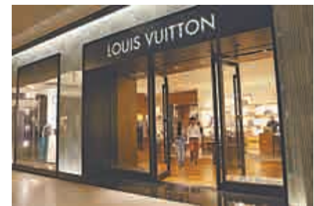
▲Louis Vuitton母公司奢侈品零售商LVMH昨日公布季度業績

至於集團旗下香水及化妝品業務，首季收入錄得12.13億歐元（約107億港元），按年增長9%，主要受惠Christian Dior品牌的強勁銷售。