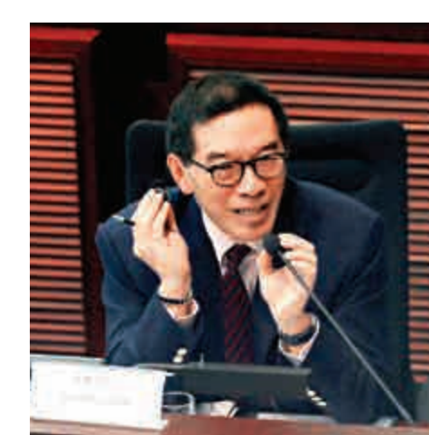
▲證監會主席唐家成曾表示，有留意到創業板上大落的情況，並指會和港交所檢討整體上市政策

由於自去年11月底起，證監會主席唐家成表示，有留意到創業板上大落的情況，並表示在和港交所（00388）檢討整體