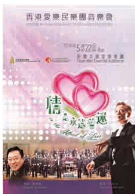
▲「情是永遠着迷」音樂會海報

門票現於城市售票網發售：www.urbtix.hk。查詢節目詳情可電九一〇二〇六四三，或瀏覽香港愛樂民樂團網頁：www.hkmlco.org。