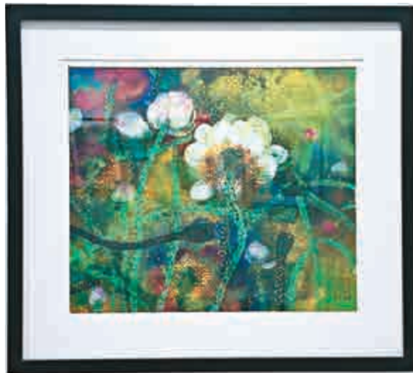
▲林天行彩墨作品《遙迎》