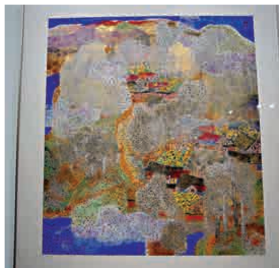
▲林天行「鄉村系列」作品《山居》

林天行繪荷，已然成癡。因為在他看來，荷既象徵君子的高潔，更是佛家的象徵。是次展出作品，林天行延續以往一貫的繪荷手法，將心中的荷，融入山水之中，融入天光雲影當中，畫面光彩耀人，譬如作品《五彩的地方》，畫面中的荷，絢麗繽紛，各種色彩鬥艷，好不熱鬧。林天行說：「縱使畫面一派繁華，亦不影響荷的高潔，因為荷不受任何環境所左右，我