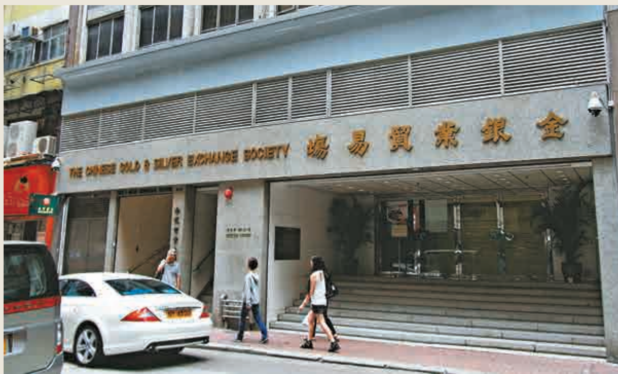
▲本港應充分利用「黃金滙港通」的交易平台和離岸人民幣市場優勢，進一步鞏固亞洲黃金中心地位

作為全球黃金的生產和消費大國，中國在爭取黃金定價話語權方面取得標誌性進展。上海黃金交易所昨日發布全球首個以人民幣計價的黃金基準價格，首筆「上海金」基準價為256.92元（人民幣，下同）／克，當日「上海金」集中定價合約正式掛牌。