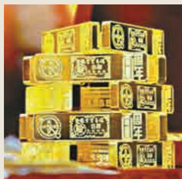
▲香港是亞洲主要的黃金集散地，也是國際黃金市場連接中國的門戶，在亞洲實金交易市場中具有重要地位