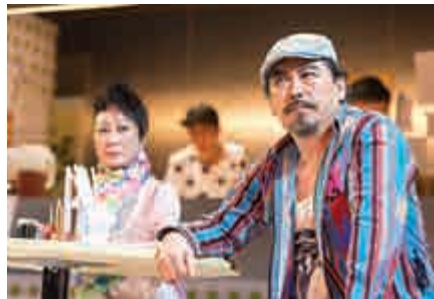
▲茶餐廳的布景，港味十足