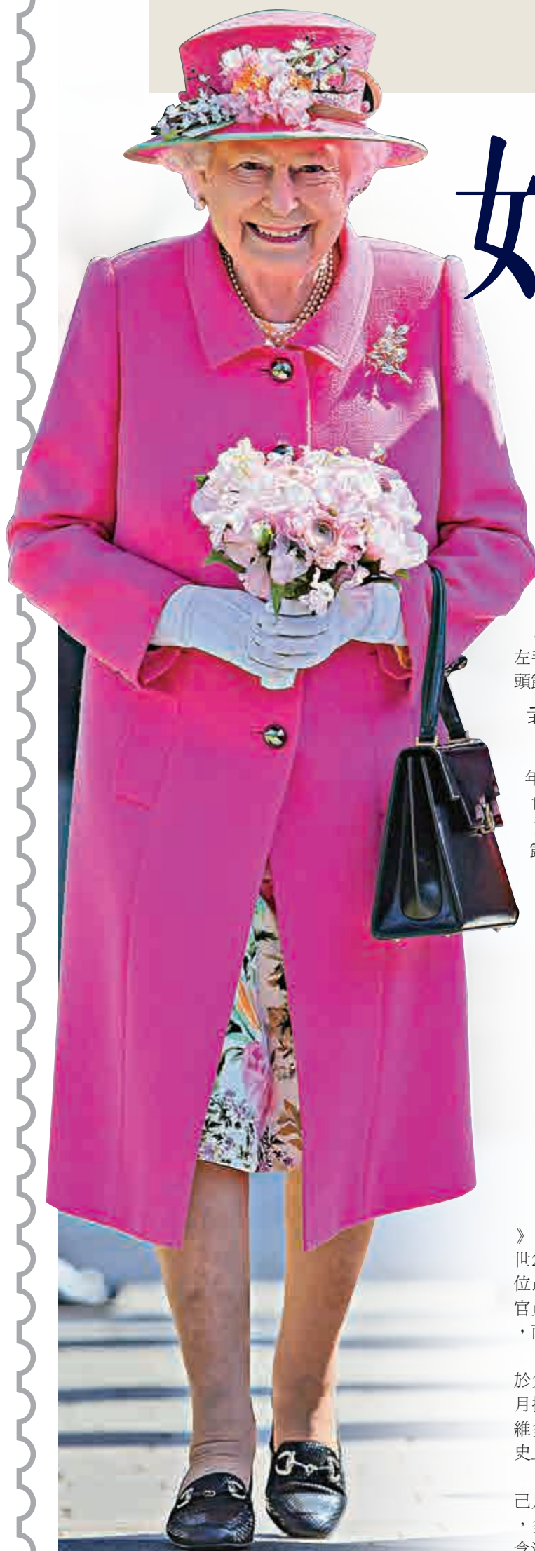
▲英女王20日在倫敦出席公開活動

在這張全家福照片中共有四人出鏡，分別是英女王、查爾斯王子、威廉王子以及喬治王子，他們同時也是現任君主，以及第一、二、三順位繼承人。而照片上最搶眼的當屬喬治小王子，他站在一疊泡沫板上，左手緊握父親威廉王子的手，望着鏡頭露出燦爛的笑容，展現萌娃風範。