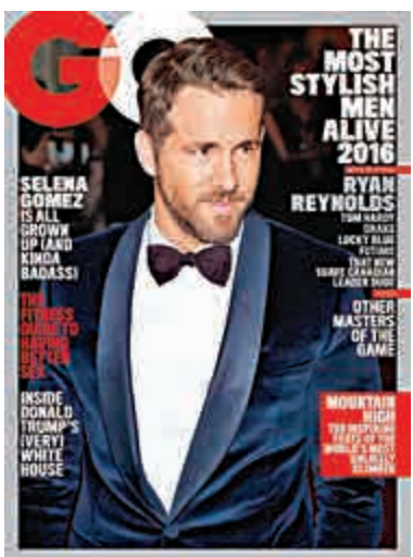
►賴恩雷諾士登上GQ封面