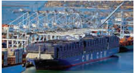
▲達飛輪船、中遠集運、長榮海運及東方海外成立新航運聯盟「大洋聯盟」

至於由總統輪船、現代商船、商船三井、赫伯羅特、日本郵船和東方海外組成的G6聯盟，隨着達飛海運收購總統輪船，東方海外組建新聯盟，失去兩位大將的G6聯盟，能否繼續走下去，亦成為了問題。無論如何，隨着新聯盟的成立，相信其他航運公司也無法淡定，會積極尋找應對方法，應對市場變化。