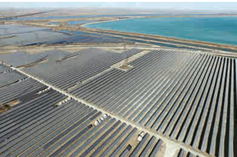
◀內地光伏業發展一直受到補貼滞后及地區限電兩大問題困擾，投資者買入光伏股時要留意國家會否推出新政策改善有關問題

該公司上季手機及其他產品銷售量按年增長9%至1710萬台，當中智能終端銷售量按年減少9%至880萬台，整體平均銷售價格從54.7美元跌至41.8美元。郭愛平預期，上半年純利仍有機會大幅倒退，但隨著新產品推出，相信下半年銷售額和毛利會逐步回升，推動利潤增長。