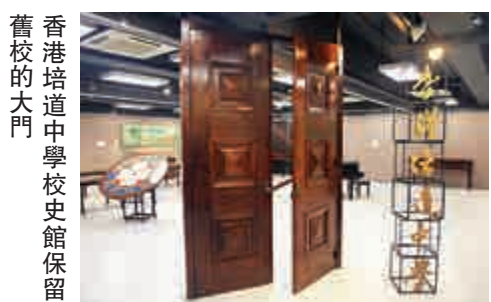
香港培道中學校史館保留舊校的大門

廣州培道中學在抗戰期間也過着顛沛流離的生活，先遷往肇慶躲避戰火，一九三八年南下香港。香港淪陷後，培道轉往澳門繼續辦學。一九四五年總校復課，同年在港開設分校。翌年獨自辦學，命名為「香港私立培道女子中學」，一九五四年在延文禮士道建立校舍。今天兩間學校已先後重建，舊貌消失，只能從它們的校史館緬懷過去。