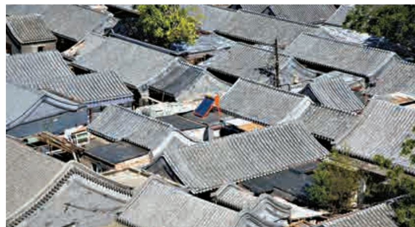
▲胡同舊房子每平米價格多在十萬元人民幣以上 網絡圖片

最老胡同： 三廟街胡同。長椿街國華商場後身的三廟街一帶，遼代稱檀州街，距今已有900多年歷史