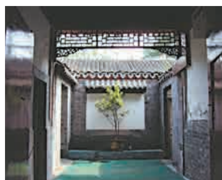
▲四合院別有洞天

近年，總布胡同梁思成、林徽因故居等衆多名人故居陸續被拆除，引發各界強烈關注。三廟街胡同所在的三廟社區負責人告訴大公報記者，很多老胡同都有深厚的文化底蘊，若保留下來，其考古價值、旅遊潛力都將大於拆除後的經濟效益。