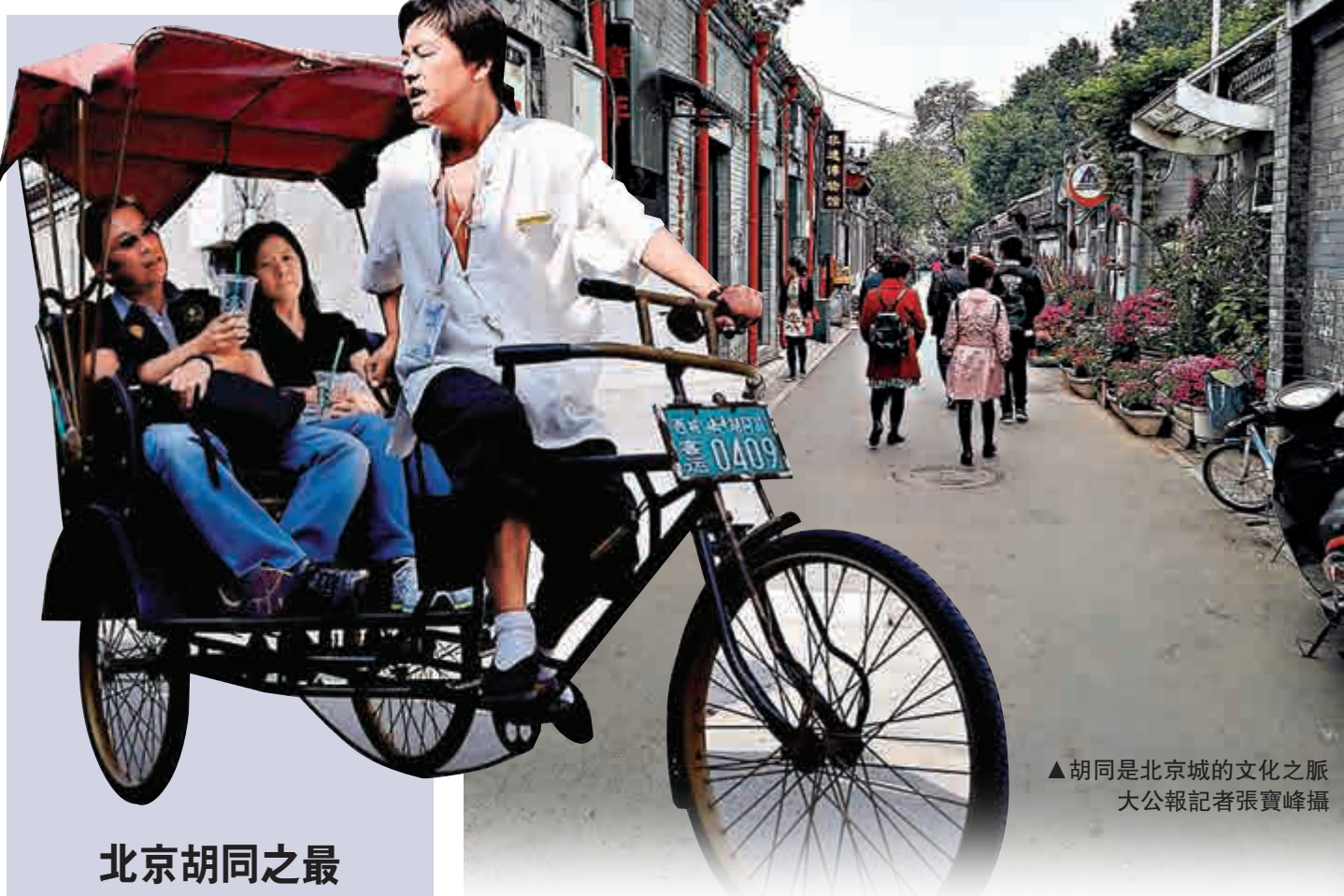
▲胡同是北京城的文化之脈

即使磚瓦不再，但對於北京來說，胡同的意義早已超越了交通通道本身，它更像是老北京人生活的依託，北京城文化的脈絡。它好似一座北京風情博物館，記錄着這座城市的發展變遷，展映着萬千生靈的律動流瀉。