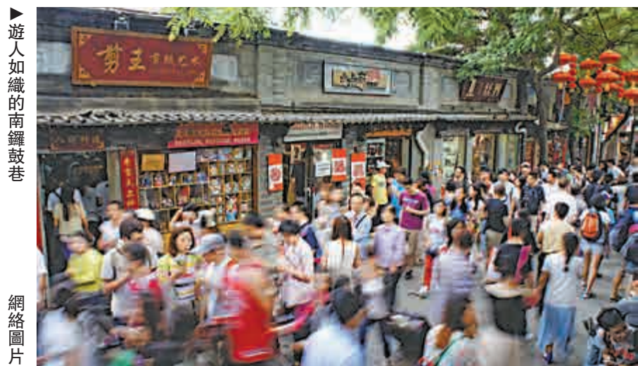
▲遊人如織的南鑼鼓巷