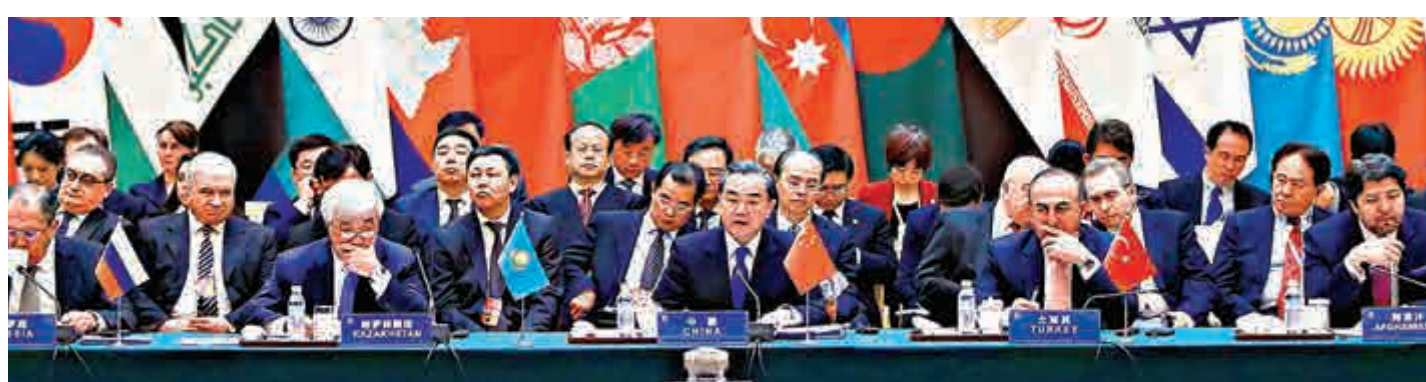
▲4月28日，亞洲相互協作與信任措施會議第五次外長會議在北京開幕

亞洲相互協作與信任措施會議第五次外長會議4月27日至28日在北京舉行。亞信成員國、觀察員國和有關國際組織等40餘個代表團出席會議。