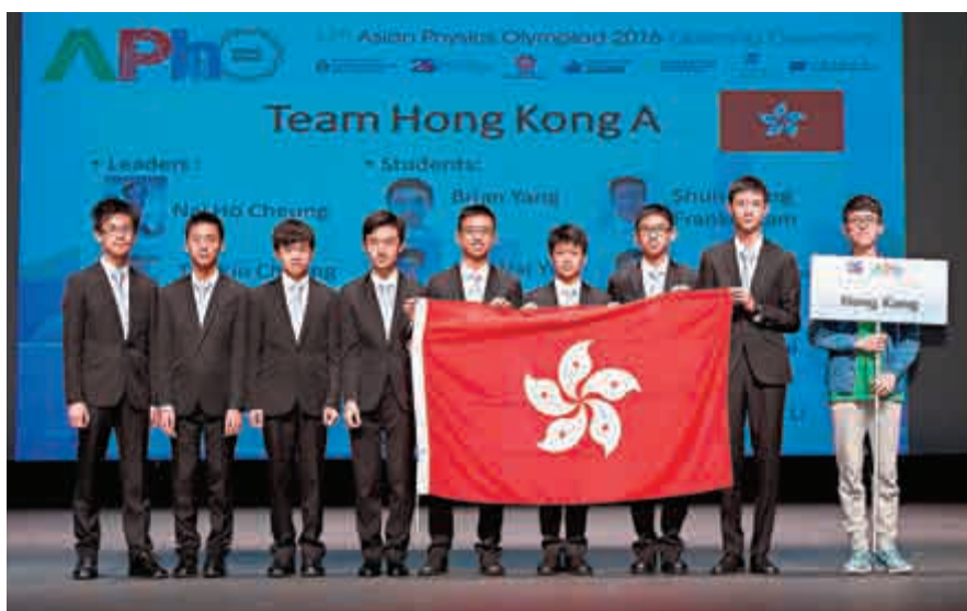
▲香港派出兩隊同學參加「亞洲物理奧林匹克」

亞洲物理奧林匹克是為亞洲高中生而設的年度國際物理學比賽，以國際物理奧林匹克為藍本，旨在推展青少年的物理學教育，培育和啟發在物理學方面具優秀潛質的青少年。科大會多次應香港資優教育學苑委託，培訓參加亞洲及國際物理奧林匹克的香港代表，至今已培育了73名亞洲及國際物理奧林匹克的金銀及銅牌得主。