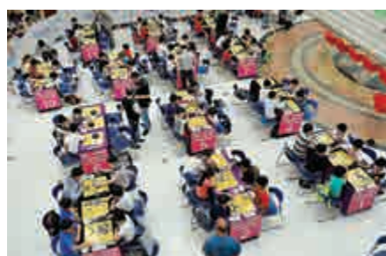
▲大埔超級城舉行「2016年首屆小學圍棋賽」

是次小學圍棋賽屬邀請賽，有八間位於大埔的小學應邀參賽，逾80名學生對弈。比賽分低小(小一至小三)及高小(小四至小六)兩組，參賽學校以小隊方式出