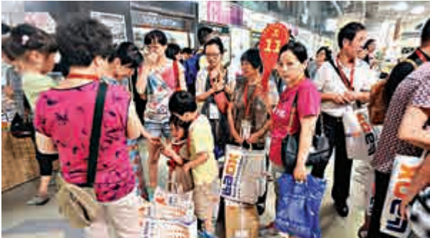
◀在全球化開放的大市場下，中國人有更多的機會出國旅遊購物，有更多選擇物美價廉的機會

原因四，「產業升級」落後於「消費升級」，是中國購買力外流的根本原因。隨着國民收入水平不斷提升，居民的「消費升級」現象愈發明顯，而中國傳統零售業和製造業卻無法滿足居民的「消費升級」要求。由此，「消費升級」與「出國旅遊」兩股力量疊加，就催生了出頗為壯觀的海外購物潮。