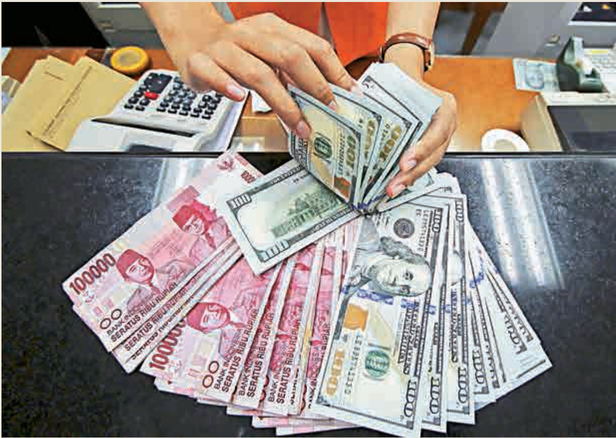
◀寬鬆政策似乎不再有效，因為寬鬆政策一旦落地之後，本幣旋即升值

無論是發達經濟體的貨幣寬鬆，還是新興經濟體的財政寬鬆，都在不斷迫近市場心理的臨界點。無論你是否願意承認，當前的全球經濟已深陷「囚徒困境」之中，無以自拔。