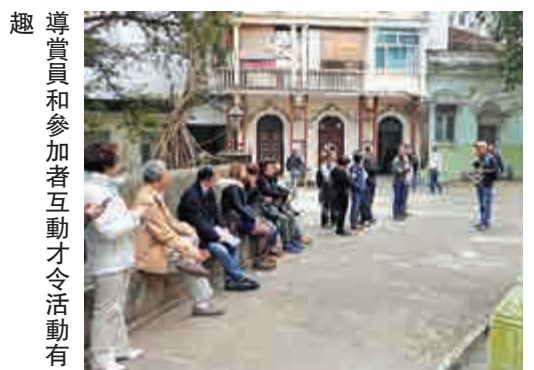
導賞員和參加者互動才令活動有趣

儘管導賞員準備充足，若參加者無心聽講，也是徒然。因為兩者是互動的，參加者用心聆聽，不時發問，才能激發導賞員講得更多，說得更起勁。反之，沒有人提問，頻頻與同伴說話或看手機，都會令活動變得枯燥乏味。