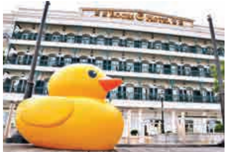
▲黃色小鴨駕臨澳門漁人碼頭

有興趣於與黃色小鴨同遊澳門的話，亦可於即日起至5月29日到澳門漁人碼頭勵庭海景酒店及萊斯酒店的酒店官方網站及致電預訂期間限定住宿優惠，即享客房免費升級驚喜。入住以布拉格為設計風格的勵庭海景酒店只需澳門幣1038元起，而以18世紀維多利亞時期為題的萊斯酒店的高級客房只需澳門幣1068元起。為了讓住客與黃色小鴨有更親密的接觸，預訂的客人不僅可免費升級服務，酒店更送出可愛的黃色小鴨造型2位用的下午茶及精美禮品，住客更尊享延遲退房服務，悠閒地享用免費自助早餐。客人在住宿期間輕鬆的玩耍，如此震撼的驚喜優惠，定能為賓客帶來難忘的住宿體驗。