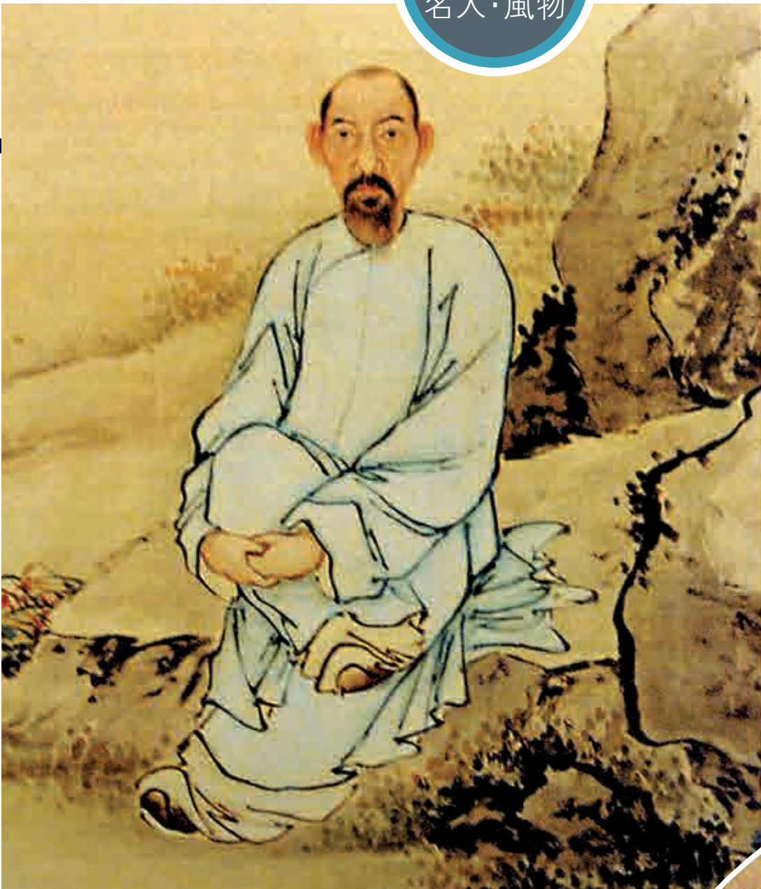
◀《林則徐畫像》 見朱誠如主編《清史圖典》，第9冊道光朝