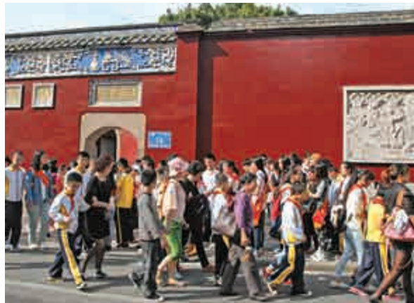
▲福州「林文忠祠」，瞻仰、參觀者絡繹不絕 作者攝

奇恥大辱 清朝反侵略、反販毒的鴉片戰爭失敗，被迫割讓香港，是屈辱的近代史的開始，也是香港等地一些人「悲情」的起因。在後來有些人看來，當時的統治者對於國家領土及生活其上的人民，似乎如同宋代蘇洵《六國論》所指：「視之不甚惜，舉以予人，如棄草芥。今日割五城，明日割十城，然後得一夕安寢。」歷史事實是，《江寧條約》是英軍以攻佔南京為要挾訂下的「城下之約」，道光皇帝把割讓香港視為奇恥大辱，愧對祖宗，愧對天下百姓。 道光帝在北京收到耆英錄有《江寧條約》文本的奏摺，下旨道：「覽奏忿懣之至！朕自恨自愧，何至事機一至如此？」林則徐在新疆根據朝廷內部資料《京報》輯錄的《軟塵私議》記載：「傳聞和局既定，上（道光帝）退朝後，負手行便殿階上，一日夜未嘗暫息，侍者但聞太息聲。漏下五鼓，上忽頓足長嘆，旋入殿，以朱筆草書一紙，封緘甚固。時宮門未啓，令內侍持往樞廷（軍機處）……蓋即諭知諸臣書押定約之廷諭也。……宣宗之議和，實出於不得已。」另據當時官員筆記記錄，割讓香港的當年歲暮祭祀祖廟時，道光帝長跪不起，痛哭失聲。不平等條約成為他終生抹不去的傷痛，臨終遺詔表示自己沒資格像祖先一樣配享天地。 祖宗家法 決不割讓領土，是清朝皇帝的祖宗家法。道光皇帝的母親慈禧太后立場也是寸土不讓。據《翁同龢日記》同治五年（一八六六年）四月十六日記載，