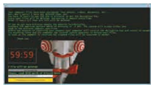
Jigsaw勒索軟件入侵的電腦，文字檔全部「亂碼」，會出現恐怖小丑面具圖片