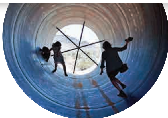
◀民眾進入管道內

【大公報訊】綜合英國《每日郵報》、美聯社報道：美國「超回路1號」公司11日在西部內華達州荒漠首次對「超回路技術」中的推進系統進行公開測試，測試結果符合預期。科技狂人馬斯克提出的超高速管道運輸夢想距離實現更進一步，未來從三藩市到洛杉磯或許只需35分鐘。