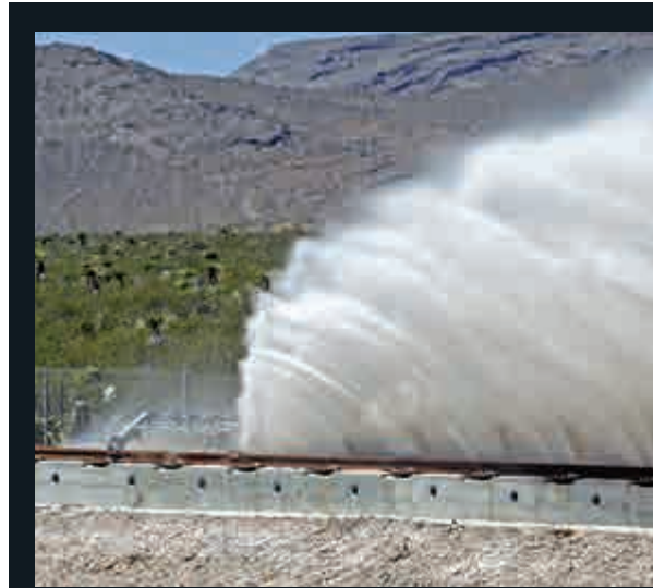
▲金屬滑車沿鐵軌加速疾馳掀起沙塵飛揚