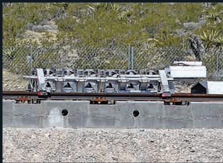
▲11日測試的只是一個沒有外殼的金屬滑車，並非完整列車