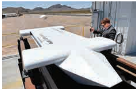
▲用於展示的測試車體

如果一切按計劃順利進行的話，預計「超回路列車」2019年前將能運輸貨物，2021年前運載乘客。