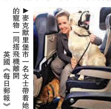
▶麥克默里堡市一名女士帶着她的寵物一同搭飛機離開 英國《每日郵報》

【大公報訊】據英國《鏡報》報道：山火吞噬加拿大麥克默里堡市，數以千計民宅嚴重毀壞，大批民眾撤