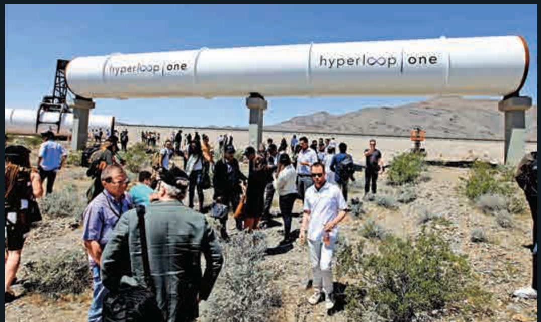
▶在場的記者和嘉賓參觀了用於列車懸浮的管道

【大公報訊】綜合英國《每日郵報》、美聯社報道：美國「超回路1號」公司11日在西部內華達州荒漠首次對「超回路技術」中的推進系統進行公開測試，測試結果符合預期。科技狂人馬斯克提出的超高速管道運輸夢想距離實現更進一步，未來從三藩市到洛杉磯或許只需35分鐘。