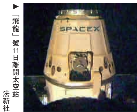
▶「飛龍」號11日離開太空站