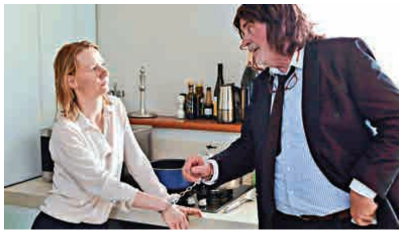
《東尼雅曼》講述父女間的感情

另外，法國導演阿倫基洛迪(Alain Guiraudie)的《保持直立》(Staying Vertical)是今屆的奇片，表面上描寫一名編劇為取得靈感，住到山區並結婚生子，突然人人變成同性戀，主角更幾近身敗名裂。片中鏡頭露骨，情節荒誕，結局的安樂死橋段更匪夷所思，令觀眾啼笑皆非。