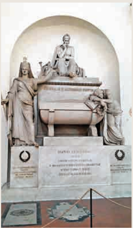
▲但丁榮譽塚

我丈夫於是說：「那我先進去探一下情況，如果真的太嚇人了，你就別進去了。」這反倒激起了我的勇氣，就說沒事的，我一定會活着出來的。那份忐忑的心情在進入教堂的瞬間就化解了，裏面闊達通趟，與一般的教堂相比可能要稍暗一些，但是並沒有引發心肌梗塞的危險，我丈夫