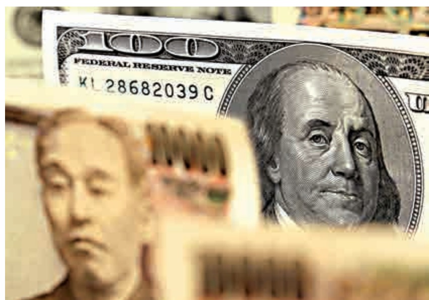
◀ 弱美元政策重新抬頭了，日圓匯價恢復強勁升勢 資料圖片