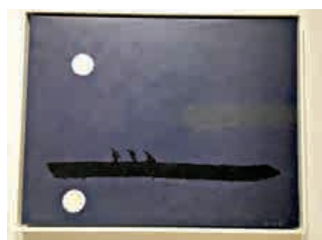
▲葉世強作品《筏和三魚》