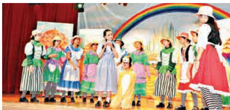
◀朱石麟中學初中生活演話劇《綠野仙蹤》