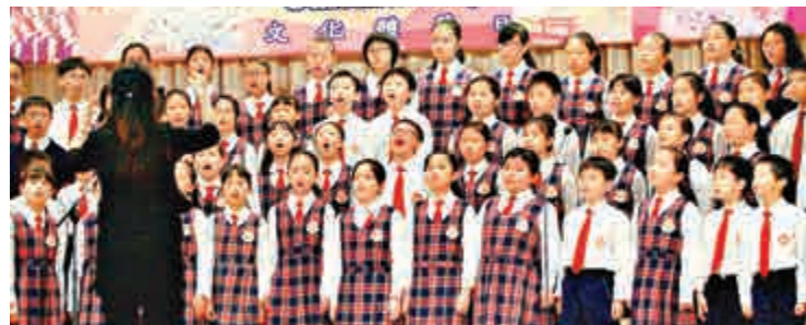
◀婦女會中學「文化體藝日」請來友校學生參加表演

多年來，朱石麟中學為推動同學學習英語的興趣，舉辦了不同的學習活動，例如「英語話劇工作坊」、「英語辯論工作坊」、「遊香港學英語」活動、「英語日營」和「英語廚房」等，藉此營造愉快學習英語的氛圍，提升同學的學習信心，是次英語音樂劇演出成功，實在是師生努力不懈的明證。