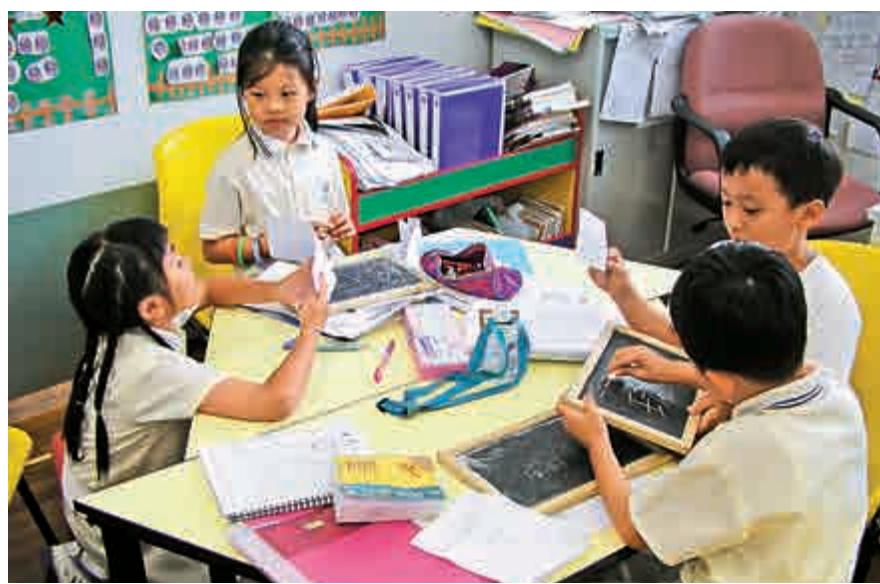
▲在上世紀末開始，香港的教育便強調要學懂「兩文三語」

計對象，一可以說保持或提升水平，二則可以回應以中產階級為對象的輿情。但是，希望家長明白，你們話病的學校課程往往是因為如此輿情而由上而下對學校教育