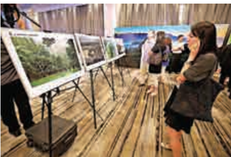
▲貴州省昨在港舉辦茶旅推介會

李三旗稱，貴州正大力發展山地旅遊、全域旅游，全省已開展「文明在行動，滿意在貴州」活動，全面提升當地旅遊服務品質及水準。