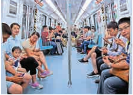
▲特意乘坐首班地鐵的東莞市民