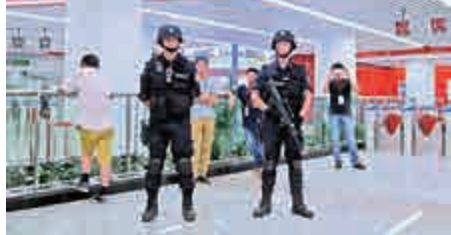
▲東莞首條地鐵安保嚴密

深鐵路無縫接駁，港人可從深圳羅湖坐和諧號到東莞火車站，可直接在內部換乘。在2號線西平站，則可以「T」字換乘到惠州的莞惠城際線。在地鐵虎門火車站，可與廣深港高鐵以及穗莞深城際線換乘。