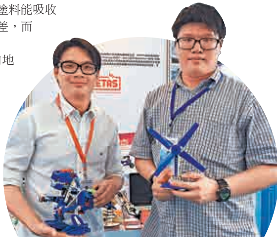
▲參加此次創交會的香港公司工作人員向記者展示產品

在27日下午的穗港澳台科技、產業（大數據）發展論壇上，香港中文大學建築學院教授鄧經宇回顧穗港澳台在綠色建築、智慧建築、低碳城市等方面各自取得的經驗與發展成果，分析在應對氣候變遷、大數據與信息化快速發展下面臨的共同人居問題，強調可以通過學術和科研的交流合作，來進一步應用綠色化與智慧化科技成果，特別指出香港已是老齡化社會，未來廣州也將步入老齡化，將對地產商開發建設住房提出不同的設計要求，廣州可以借鑒香港經驗建設發展更適合老年人的人居化環境。