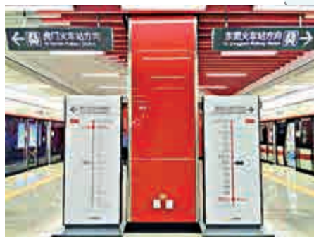
▲東莞地鐵站內情景

東莞地鐵2號線昨日正式開通，共設有15個車站，設計最高時速120公里，車速冠絕內地。港人今後從深圳羅湖乘坐廣深和諧號到東莞火車站，可直接在火車站旁邊地鐵站口換乘2號線，或在深圳北站乘火車至東莞虎門火車站後換乘地鐵2號線，北上更添便利。