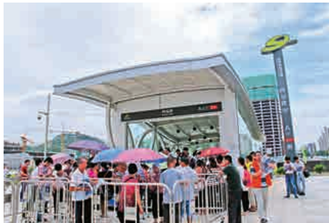
▲排隊等地鐵開通的市民