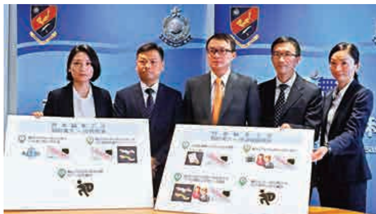
▲商罪科詭騙案調查組人員介紹假樓契騙案手法 大公報記者陳卓康攝