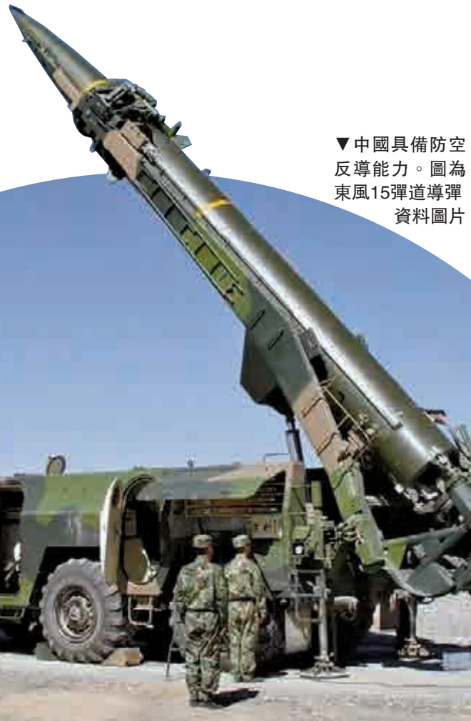
▼中國具備防空反導能力。圖為東風15彈道導彈資料圖片

【大公報訊】據環球網報道：內地軍事專家李杰指出，「空天安全-2016」反導演習是運用以電腦為核心的現代模擬技術，首先設計敵方的導彈來襲路徑、頻次、打擊手段、指揮控制通信系統及雷達等，考慮各種情況的出現，並採取應對手段。 對於中俄兩國的反導優勢，李杰認為，俄羅斯反導系統配套的預警設備、抗擊手段