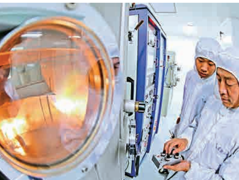
◀應用於中國空間站照明系統的窗口照明玻璃，去年十月在河北秦皇島研製成功 去

據《中國青年報》報道，這是國防科工局第一次在正式場合對外提及長征八號。此前，全國政協委員、航天科技集團中國運載火箭技術研究院原黨委書記梁小虹曾在2015年全國兩會期間透露，作為新型的太陽同步軌道火箭，長征八號當時正處於論證階段。