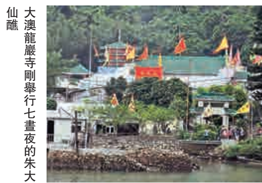
大澳龍巖寺剛舉行七晝夜的朱大仙醮

龍巖寺的大雄寶殿供奉三尊像，中央為佛祖釋迦牟尼，左為觀音，右為朱大仙，殿旁還有一座「朱大仙寶塔」。該寺請佛教僧侶主持醮會，雖不是在船上舉行，但也會乘船出海祭幽，並擺設兩座大士王紙紮像，分管水陸亡靈。