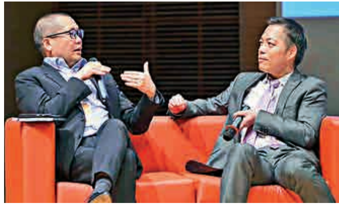
▼主辦方邀請本地及海外的文化領袖、文化企業家及行政人員探討「共創成功的藝術」 大公報記者周怡攝