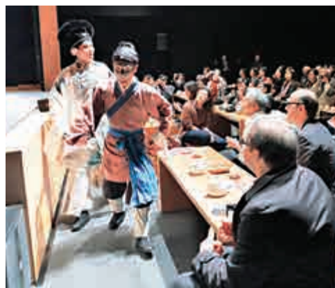
▲此前西九戲曲中心展開「茶館劇場」模擬體驗 資料圖片

此外，專題講座「藝術給予社會的正能量」、圓桌討論「藝術拍檔、夥拍藝術」等活動今日在演藝學院舉行。查詢更多詳情可瀏覽網址：www.hkaa.org.hk。