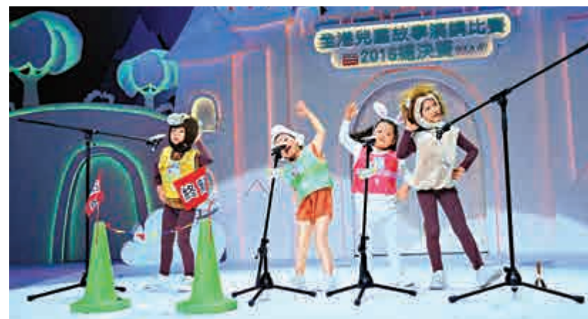
▲合作組冠軍隊伍悉心打扮，演繹故事《永不放棄同學仔》更是手舞足蹈