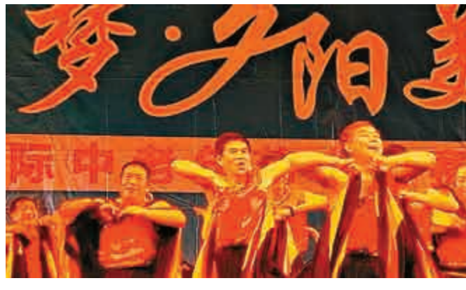
▲《七彩雲南》歌舞現場照

保山市金秋團成立於二〇〇七年，現有團員四十人，平均年齡六十歲，是一支在當地非常活躍的優秀老年人業餘文藝團隊。他們曾多次代表保山老年人出席全國、省級、市級舉辦的各種舞蹈比賽並獲得多個獎項。獲獎作品的舞蹈靈感來自於雲南多個少數民族，如傣族、彝族、布朗族、德昂族等。