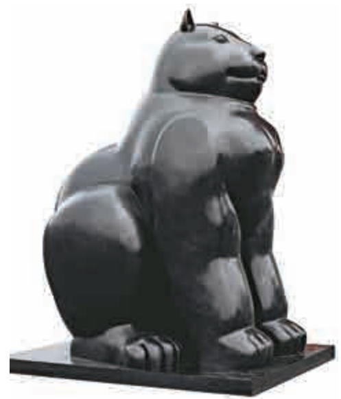
▲博特羅一九九九年作品《貓》

博特羅塑造的雕像着色的不多，更多是以自然物質本色為主。博特羅說：「雕塑傳達自然的美，如果人們去融入其中，感受美感和雕塑創造的快樂，撫摸這些形體，那就說明藝術家取得了重要的成就。」博特羅在成為雕塑家之前，首先是一個畫家，而將二維平面的繪畫