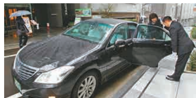
▶Uber首次成功進入日本市場