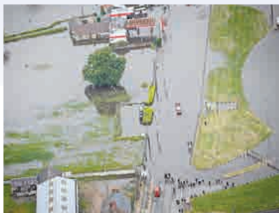
▲巴黎西南部城市布魯瓦部分地區被洪水淹沒

法新社在報道中稱，洪災連同上月爆發的罷工事件為即將於一週後舉行的法國歐國杯蒙上了一層陰影。目前正在法國舉行的法國網球公開賽同樣受到豪雨影響。上周一，賽事組委會宣布取消當日全部比賽，導致賽事至決賽前賽程都將十分緊湊。