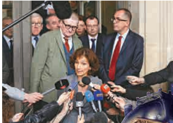
▲法國文化部長向媒體介紹關閉羅浮宮的情況