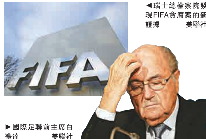
◀瑞士總檢察院發現FIFA貪腐案的新證據

去年9月和今年3月，瑞士總檢察長勞伯先後對白禮達和瓦爾克就未有妥善管理國際足聯款項問題展開刑事調查，兩人雖然拒絕犯錯，還是被國際足聯的道德委員會分別禁止參與足球活動6年和12年。當局則尚未對卡特納展開額外的刑事程序。