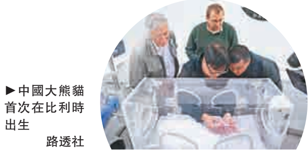
▶中國大熊貓首次比利時出生 路透社