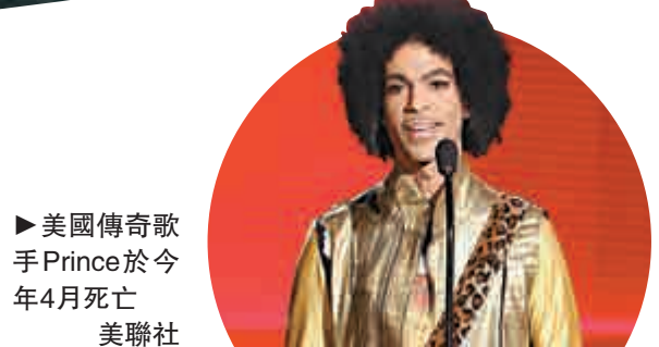
▶美國傳奇歌手Prince於今年4月死亡