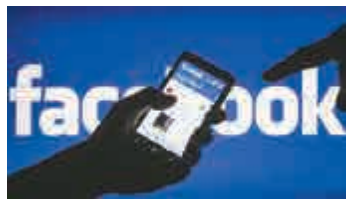
▶ Facebook 被曝利用麥克風收集用戶信息

節目播出後，Facebook作出回應稱在任何情況都不會利用麥克風推送廣告或動態消息，只會根據用戶的興趣及背景資料去推送廣告。資料顯示，Facebook早在2014年推出分析用戶四周環境聲音的功能，但該功能目前僅在美國可以使用。