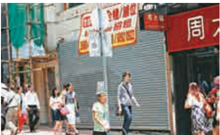
▲香港零售及出口業仍疲弱，即使5月PMI較4月略好轉，商界仍看淡前景，盡量開源節流

香港PMI已連續15個月低於50的盛衰分界線。Annabel Fiddes表示，環球經濟持續不景，客戶需求依然疲弱；香港私營企業未來數月，還將繼續面對嚴峻的經營環境。踏入夏季之際，即將公布的PMI調查