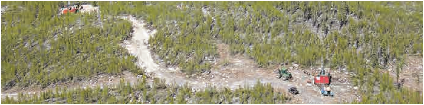
▲▼長和透過持股50%的CEF Holdings，向加拿大鈾礦商NexGen Energy購入一批可換股票據（CB），總值6000萬美元（約4.68億港元）

另外，基於開採技術的限制或缺乏市場價值，而沒有確切探勘的鈾礦資源，估計當有需要時，可以利用改良技術從鈾礦資源再獲取額外1050萬噸鈾，供應核電站約160至200年使用。由此推斷，假設核電站的數目不變，開採地球上的鈾礦資源約可供核電站使用240至300年。