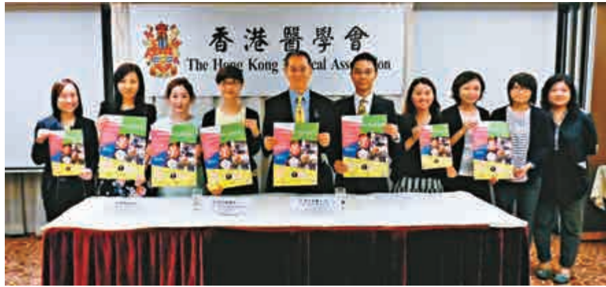
▲醫學會將辦音樂會，籌款目標為一百萬元