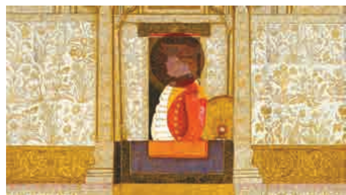
▲《最後崗位》內容觸及殖民歷史

該展覽現於亞洲協會香港中心麥禮賢藝術中心展至七月九日。有關詳情，可瀏覽 http://asiasociety.org/hong-kong/ 或致電二一〇三九五一一查詢。