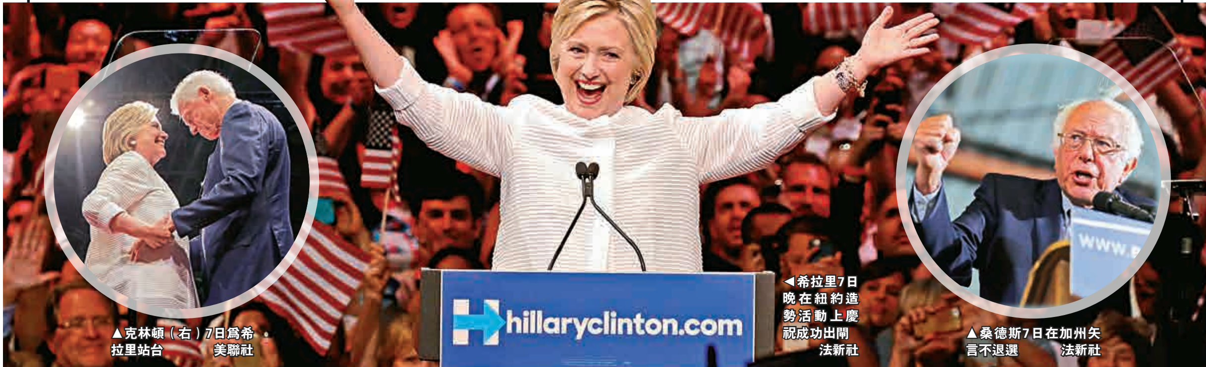
▲克林頓（右）7日為希拉里站台