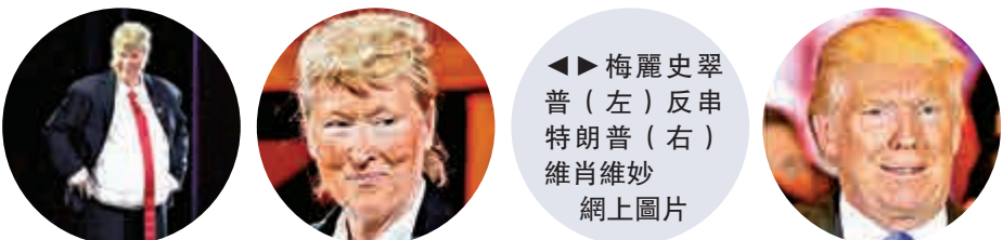
◀▶ 梅麗史翠普（左）反串特朗普（右）維肖維妙

英國BBC指，奧巴馬在年輕選民、少數族裔和改革派人群的受歡迎程度，無疑將為希拉里對抗特朗普增強信心。