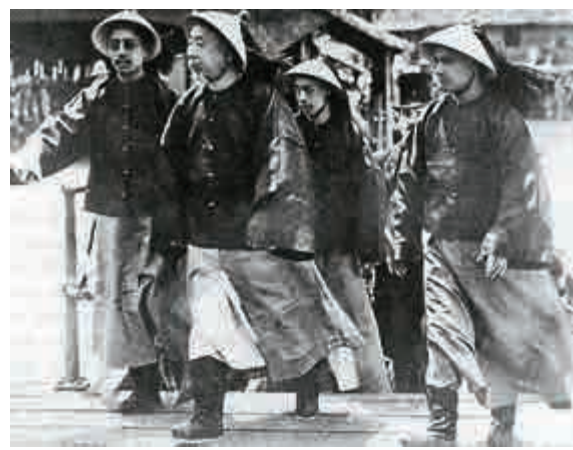
▲一九〇七年七月二十八日，第十四任香港總督盧吉（穿黑色禮服者）來港履新，在中環卜公碼頭登岸期間檢閱英軍