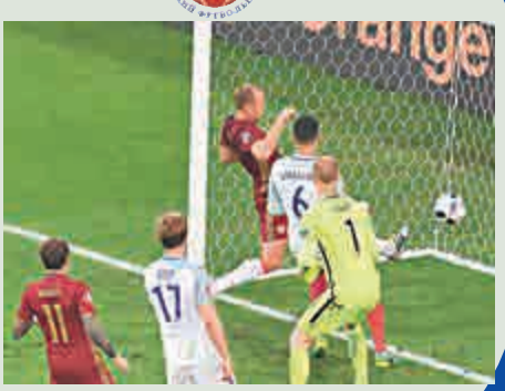
▲俄隊於補時入波扳平