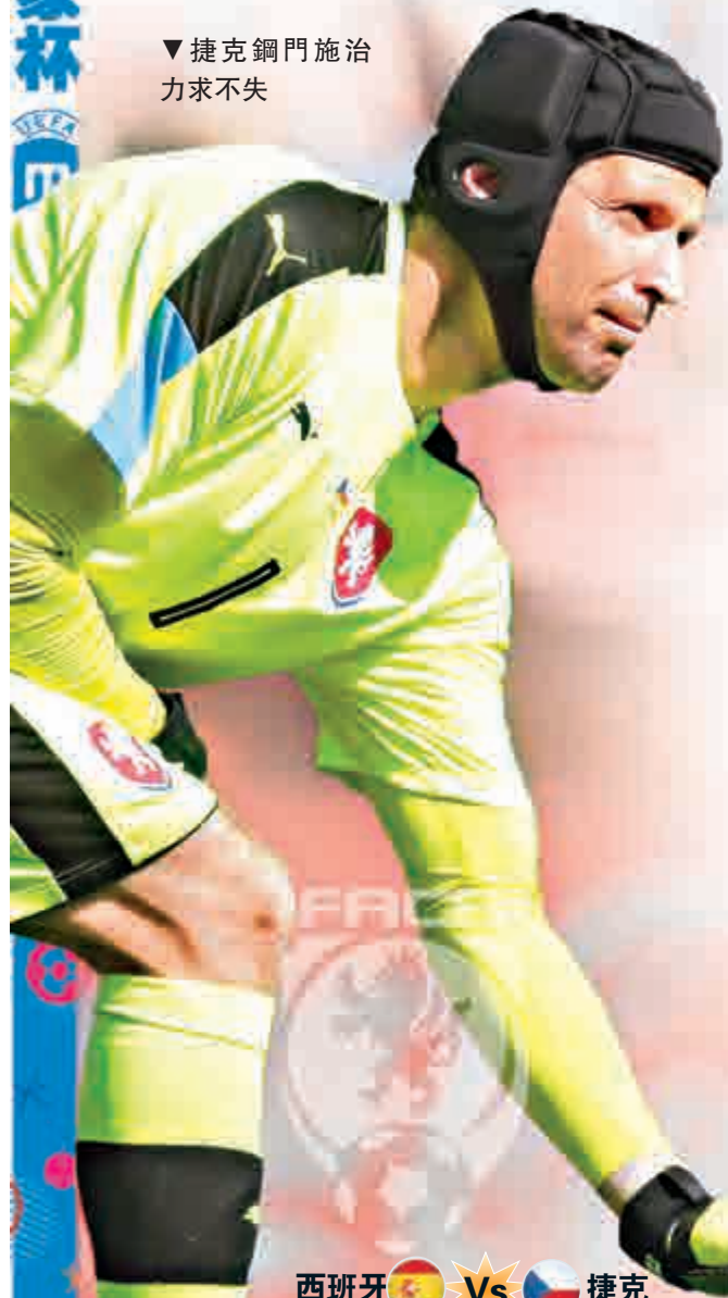
▼捷克鋼門施治力求不失

【大公報訊】綜合法新社、香港賽馬會足彩智彩報道：歐洲國家杯D組首輪第二場分組賽今晚上演，由爭取三連霸的「擂台躉」西班牙出門東歐「黑馬」捷克。西班牙經歷兩年前世界杯的慘敗，已否撥開陰霾仍屬未知數，且近日又橫生門將迪基亞的枝節，未可輕言穩勝。（now651台今晚九時直播）