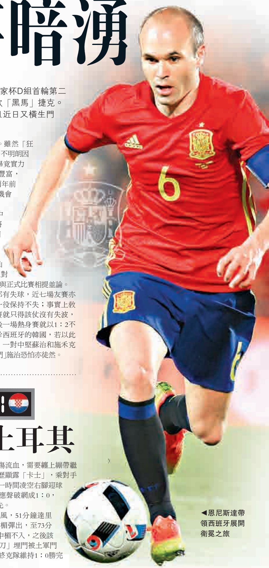
◀恩尼斯達帶領西班牙展開衛冕之旅

捷克在10場外圍賽都有失球，近七場友賽亦只有對「魚腩」馬耳他一役保持不失；事實上教練華巴上任後的22場比賽就只得該仗沒有失波，反映防守漏洞仍多，最後一場熱身賽就以1：2不敵之前一仗以1：6大敗於西班牙的韓國，若以此為參考，捷克凶多吉少。一對中堅蘇治和施克未能予人信心，縱有「鋼門」施治恐怕亦徒然。