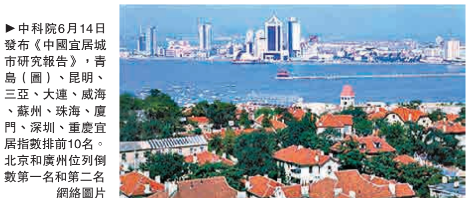
▶中科院6月14日發布《中國宜居城市研究報告》，青島（圖）、昆明、三亞、大連、威海、蘇州、珠海、廈門、深圳、重慶宜居指數排名全國40個被調查前10名。北京和廣州位列倒數第一名和第二名