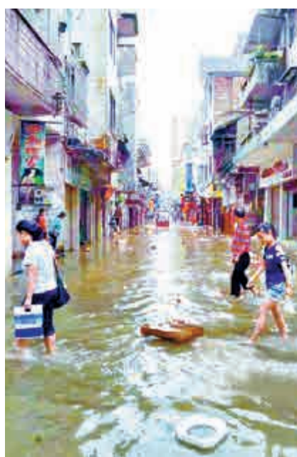
▲清遠連州中山北路成為澤國

洪水。12日零時至13日18時，粵東沿海、珠江三角洲中北部市縣和韶關、河源、清遠、汕尾、揭陽等地出現暴雨局部大暴雨。