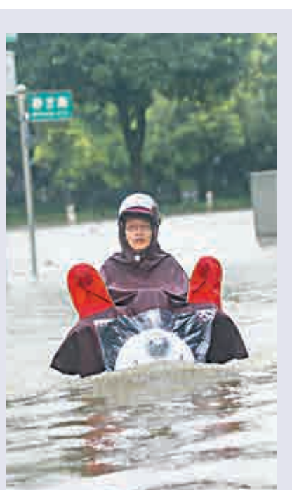
暴雨襲擊柳州 6月14日，市民在柳州市西江路積水中騎車出行。當日，廣西柳州遭受暴雨襲擊，全市多處路段積水，市民出行受到影響。（新華社）

氣象部門預計，14日至16日，廣東自西北向東南將有一次暴雨到大暴雨的強降雨過程，其間伴有強雷電和短時大風。據廣東省防總13日研判，北江流域將出現今年入汛以來最大洪水，部分支流可能出現20年一遇左右的洪水。粵西、粵東、珠三角及韓江部分中小河流可能出現超警戒洪水。短時強降雨可能導致廣東局部山區縣發生山洪、泥石流等災害。