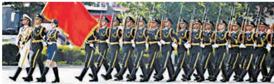
▲港生現場參觀三軍儀仗隊表演