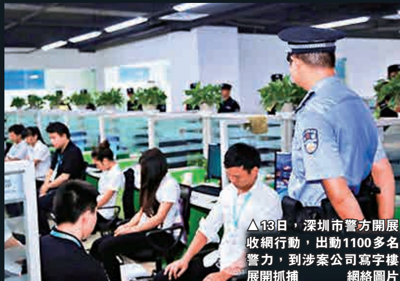
▲13日，深圳市警方開展收網行動，出動1100多名警力，到涉案公司寫字樓展開抓捕網絡圖片