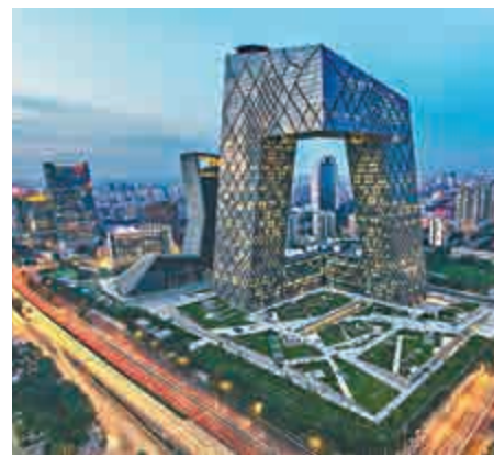
▲《北京藍皮書》預測北京經濟增速可達或超6.5% 資料圖片

值得一提的是，報告提出落實首都清潔行動計劃分解的重點任務，對北京空氣質量可能存在嚴重影響的首都機場地區，建議實行單獨的環境保護考核，形成倒逼機制，從而減少大氣污染排放。