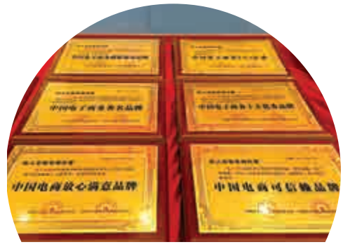
▲全國逾4000網店店主被騙，圖為詐騙合同