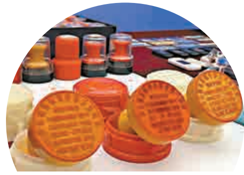
▲該詐騙集團各類公章一大堆