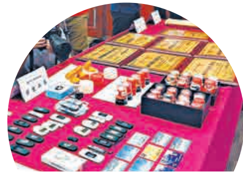
▲粵警展示詐騙集團的詐騙工具

據了解，廣東警方今年將全力推進網絡詐騙防火牆工程，力爭實現發案數和群眾財產損失雙下降的目標。