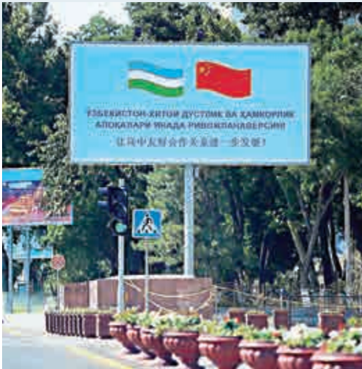
▲烏茲別克斯坦正在為習近平到訪做準備