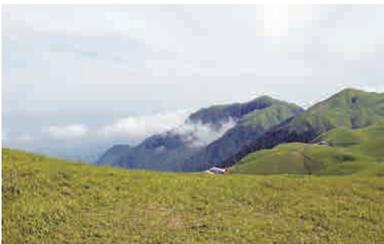
武功山被譽為「天上草原」

從山腳到山腰基本上是竹林和溪水相伴，從山腰到山頂就是一望無際的大草原了。當我們走到了一半的路程，就是翻越一個個小山頭了。此時，天上草