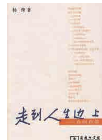
楊絳著作《走到人生邊上》

先生三口之家樸實平和的生活現狀：這是一個充滿愛的家庭，這裏有書、有愛、有學問、有歡笑，也有着濃濃的回憶和親情！楊絳沒有把錢鍾書當作大人物來敘述，也沒有把自己的家庭當成一個特例來描述，在先生筆下流淌的、勾畫的，就是一個普普通通的家庭，每個人背後卻有着萬丈光芒，平和中透着偉大。讀過之後讓人更加感嘆楊絳所描述的簡單樸實中的那份悠遠和難以企及的高度。而正是先生描寫的這種平實的生活，恰恰是我們現代人或者是我們普通人心中心中或缺和難以達到的一份