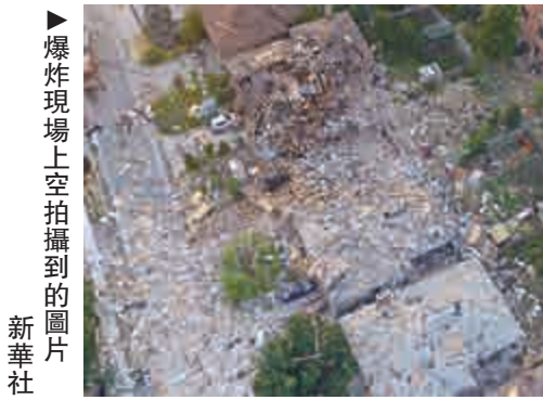
▲爆炸現場上空拍攝到的圖片