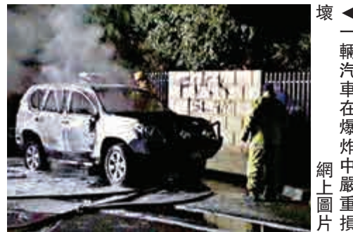
▲一輛汽車在爆炸中嚴重損壞

密西沙加市消防隊長提克特則稱還有大約24幢房屋受到了不同程度的損壞。他表示，工作人員正努力維護現場秩序，之後才可以開始調查。