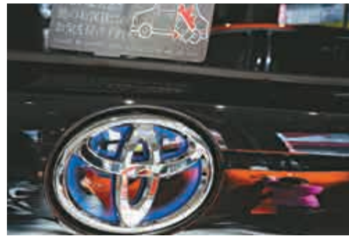
▲豐田公司一日發出兩次召回

其後，豐田又稱因燃油蒸發排放控制裝置可能存在問題，將從全球召回2006年4月至2015年8月生產的大約287萬輛Prius混能車、Auris以及Corolla車款。其中，中國區召回3.5萬輛。由於有93.2萬輛汽車在兩次召回中都有涉及，因此實際的召回數量為337萬輛。