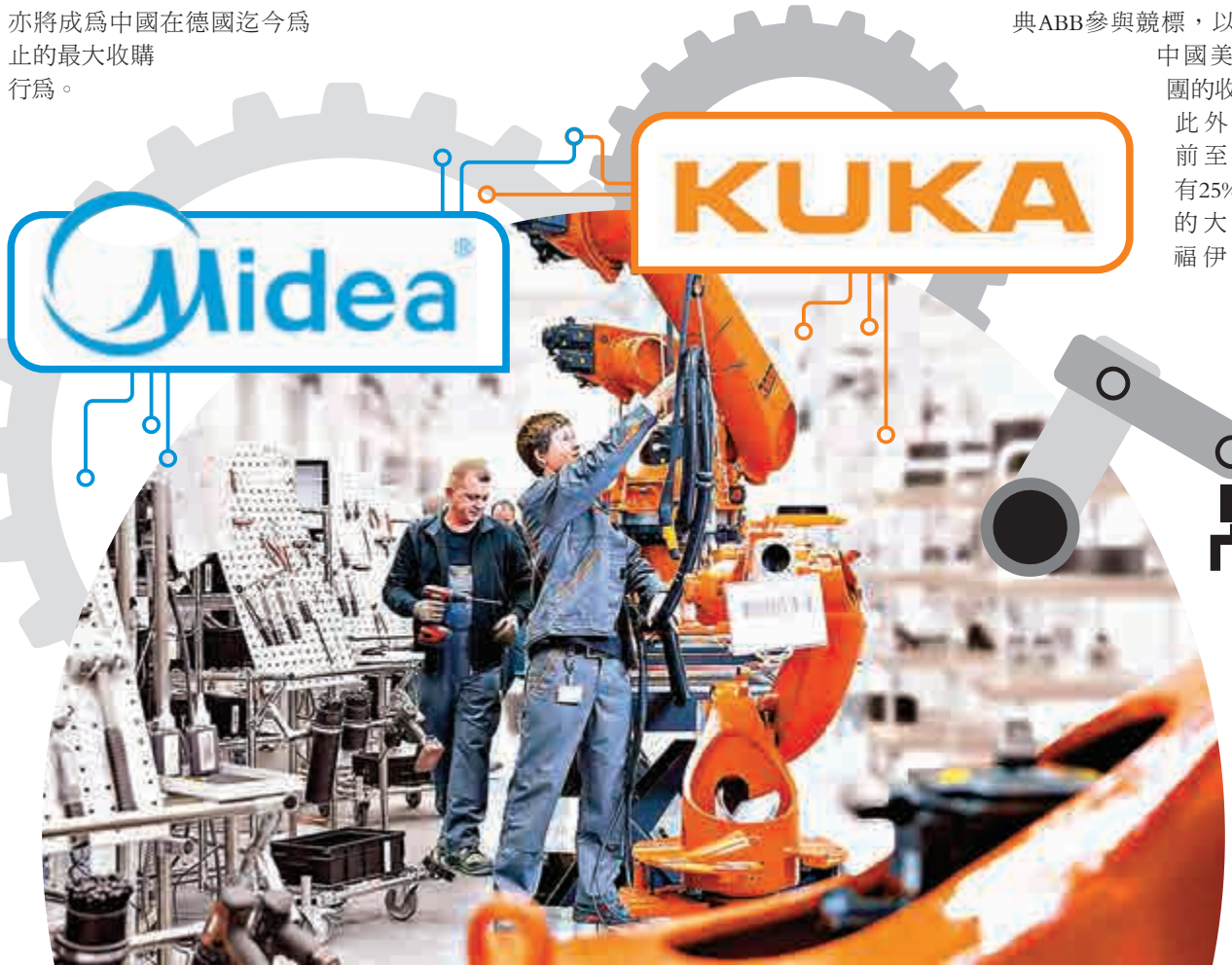
▲庫卡是德國工業4.0的領軍企業

周三庫卡在股市的價格為每股107歐元。如果美的在7月15日前完成了增持至30%股份的最低目標，收購期限將延長至8月3日。之後，德國國內將啓動反壟斷部門的批准程序，該程序到2017年3月才能結束。在此之後，美的收購庫卡的協議才算最終塵埃落定。