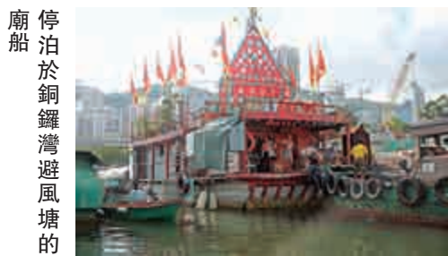
廟船停泊於銅鑼灣避風塘的

由於有關方面沒有宣傳，許多市民都不知道香港有一間海上天后廟。去年底地政署終於批出銅鑼灣消防局旁的土地建廟，讓漂浮了大半世紀的天后在陸上有容身之所。新廟採用船型設計，善信出入不需乘搭駁艇。目前漁民仍需面對兩個難題：一是不知當局何時完成審批圖則工作，其間有否阻滯；二是新廟造價千萬，還未籌足款項。至於原有的廟船，漁民希望保留，作為文物展覽，讓人們追憶往昔時光。