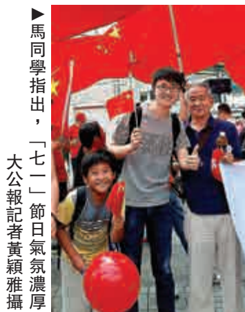
▲馬同學指出，「七一」節日氣氛濃厚