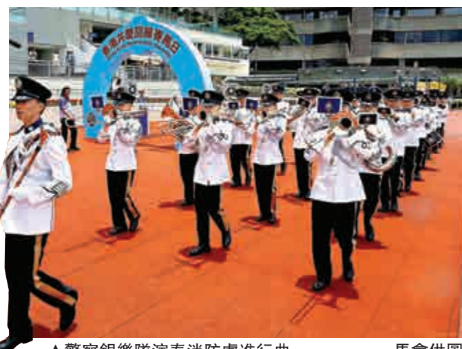
▲警察銀樂隊演奏消防處進行曲