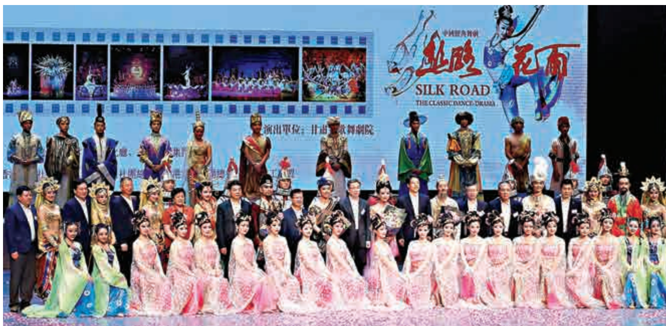
▲《絲路花雨》首場落幕時，全場響起熱烈的歡呼聲。圖為張曉明主任、宋哲特派員及一眾主禮嘉賓與演員合照

香港回歸祖國19周年，慶回歸氣氛濃厚。由香港各界慶委會主辦的系列慶祝活動的重頭戲——「慶祝香港回歸祖國19周年晚會暨《絲路花雨》經典舞劇」昨晚於香港紅磡體育館上演，吸引逾兩千名市民前來觀賞。中聯辦主任張曉明對演出予以高度評價，讚揚劇目「為香港帶來了正能量」。各界慶典委員會首席會長黃敏利表示，今年慶委會舉辦的慶回歸活動多達210場，更特別邀請經典舞劇《絲路花雨》來港演出三場，寓意香港把握國家「一帶一路」帶來的多方機遇，協助國家富強、令香港經濟再起飛。