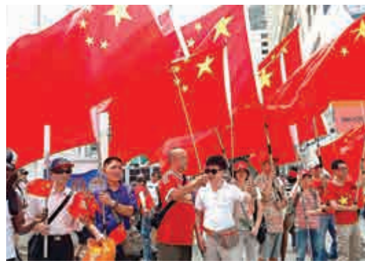
▲同心護港成員在尖沙咀向遊客宣傳香港