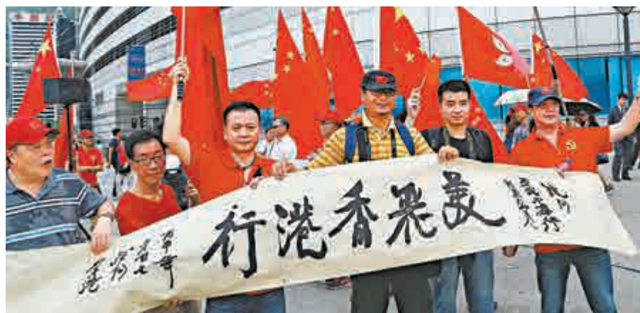
▲市民拉起橫幅賀港回歸