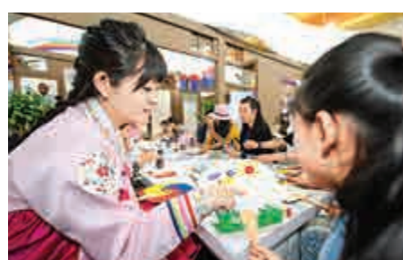
▲在第十三屆青海文化旅遊節上，韓國參展商所展出的文化藝術品吸引眾多市民觀賞

正如2015年度中華圖書特種貢獻獎青年獎得主、著名譯者艾瑞克·阿布漢森所言，這個世界是一個卡拉OK廳，裏面每個大大小小的包間都是一個文化圈，中國文化走出去並不是「登上國際舞台」，而是要在包間串門的過程中慢慢提升知名度和認可度。中國文化走出去工程，應當重視供給與需求的對接，考慮到世界文化的多樣性，才能在激烈的國際傳播競爭中獲得關注，讓書香走進絲路千萬家。