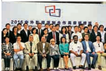
▲「2016年中外影視製合作高級研修班」在京開班