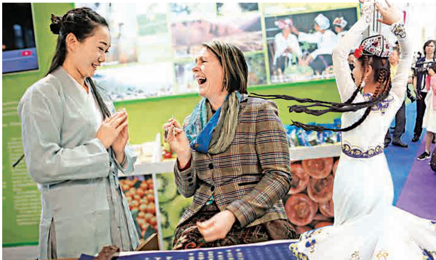
▲1月16日，在德國柏林舉行的柏林國際綠色周上，一名參觀者在中國展區體驗中國書法 資料圖片