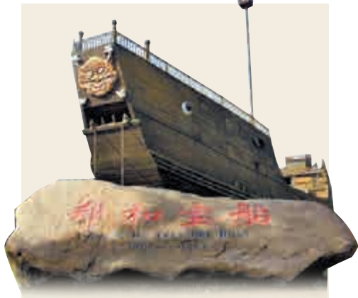
▲南京的仿古鄭和寶船