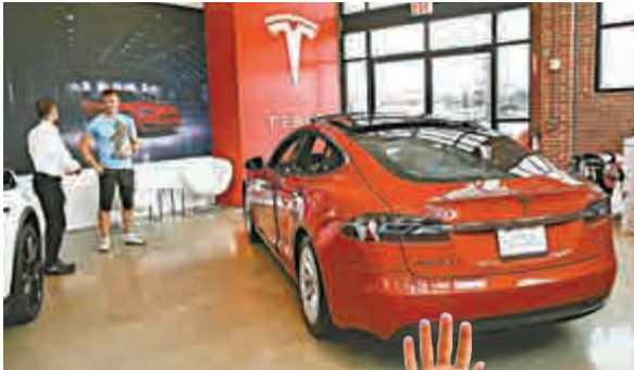
▲位於紐約的一個特斯拉電動車展廳