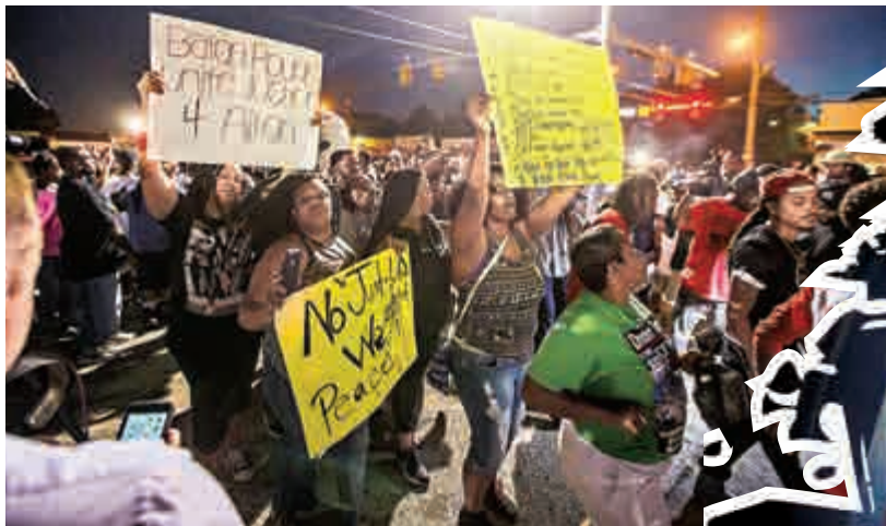
▲路易斯安那州民衆6日舉標語，抗議斯特林被槍殺

【大公報訊】綜合美國有線電視新聞網（CNN）、德國之聲、美國之音報道：美國兩日內連發兩宗黑人被警察槍殺的案件。當地時間周三晚，明尼蘇達州一名黑人男子在自己的車內被警察射殺，其同車女友在男子中槍後用手機在Facebook上直播事件，視頻隨後在網上引起瘋傳。而就在前一天，路易斯安那州爆發示威抗議，原因是警察在一家便利店外開槍打死一名黑人男子的視頻被公開。