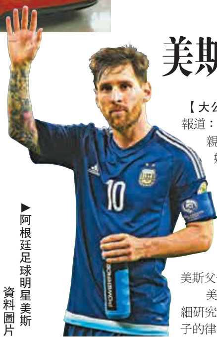
▲阿根廷足球明星美斯 資料圖片

法庭此前指控美斯及其父涉嫌在2007至2009年間，利用在伯利茲和烏拉圭的公司隱瞞肖像權所得收入，借此逃稅逾420萬歐元（約3500萬港元），這些收入來自美斯與阿迪達斯、百事可樂等多家公司的肖像權合同。