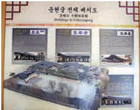
▲文物展館展出雲峴宮全貌圖

北村原為上流社會民住區，一直到一九三〇年，北村的韓屋成為了改良韓屋，既保持傳統韓屋固有的外觀和色彩，而且與近代城市的設計相容，成為一個新型的城市住宅類型。