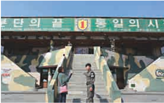
▲都羅展望台就位於DMZ內部