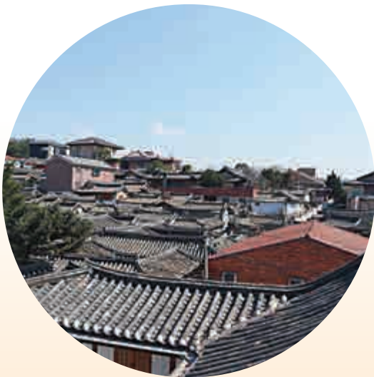
▲自上而下望北村路十一街