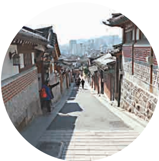
▲在嘉惠洞小巷能看到南山塔