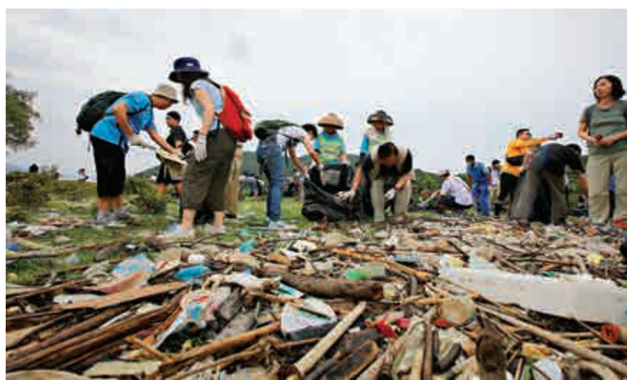
▲高官市民同心清潔香港海岸