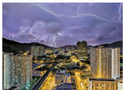
▲市民紛紛攝下閃電迸發一刻