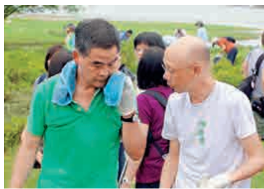
▲梁振英（左）與黃錦星（右），為清潔海岸身體力行，市民大感興奮